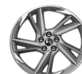
19" Leichtmetallfelge ROM