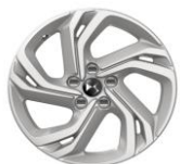
17" Leichtmetallfelge BERLIN

● : Serienmässig ○ : Option - : Nicht erhältlich