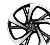
20" Leichtmetallfelge TOKYO