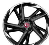
19" Leichtmetallfelge PEKING