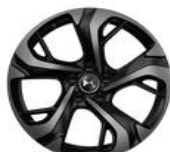
18" Leichtmetallfelge GENF