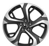
18" Leichtmetallfelge BUENOS AIRES